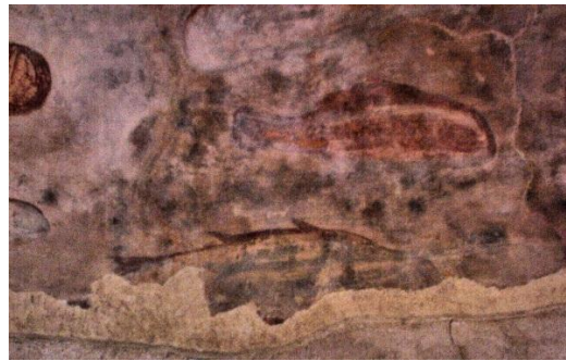
Partie de la fresque du IIIème au IVème siècle. On reconnaît ici un espadon, et un rouget ou une dorade.

Si on considère l'ensemble des représentations de la fresque, on constate que le monde marin y est bien représenté, en ce qui concerne le dauphin on aurait tendance à penser que la représentation de sa queue est étrange. Mais probablement il ne s'agirait pas de sa queue d'origine mais quelque chose qui a été ajouté après.