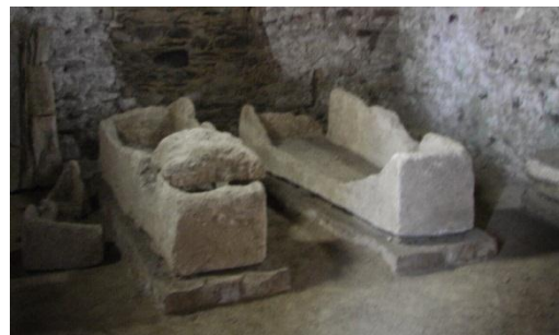
Dans le fond de la chapelle saint-agathe on peut observer deux sarcophages du haut moyen âge.

Si on considère l'ensemble des représentations de la fresque, on constate que le monde marin y est bien représenté, en ce qui concerne le dauphin on aurait tendance à penser que la représentation de sa queue est étrange. Mais probablement il ne s'agirait pas de sa queue d'origine mais quelque chose qui a été ajouté après.